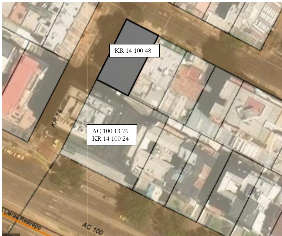
IMAGEN 1: NOMENCLATURA